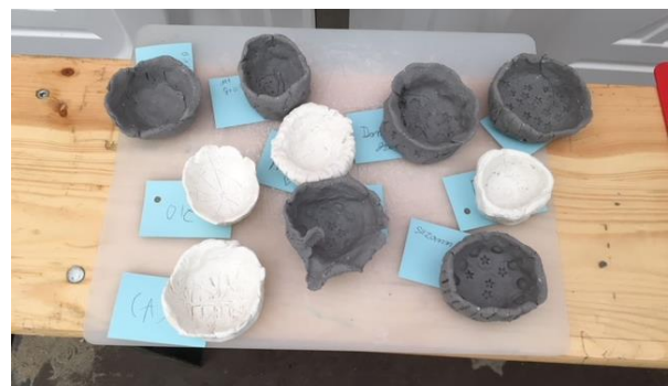
Duimpotjes met afdrukken.