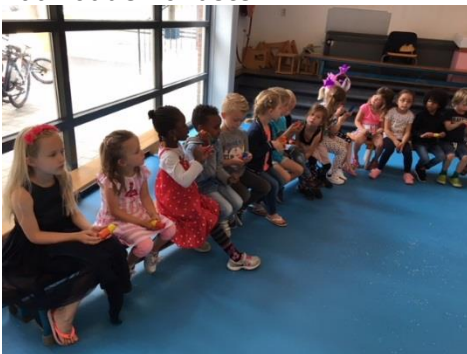
Zelfgemaakte instrumentjes in de muziekles.