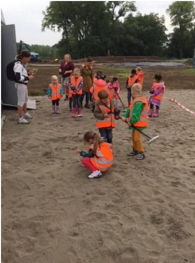
Zoeken met een metaaldetector naar oude vondsten.