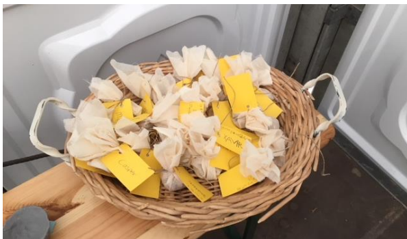
Geurzakjes gevuld met Lavendel en Havermout.

Leerlingen uit groep hebben de activiteiten de afgelopen weken gefilmd en zijn nu druk bezig met het maken van een sfeerfilmpje. Deze ontvangt u zo snel mogelijk.